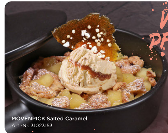
MÖVENPICK Salted Caramel Art.-Nr. 31023153

Dieses Dessert haut den Winterblues in die Pfanne: warmes Apfelkompott und Crumble, getoppt mit einer Kugel MÖVENPICK Salted Caramel und Puderzucker!