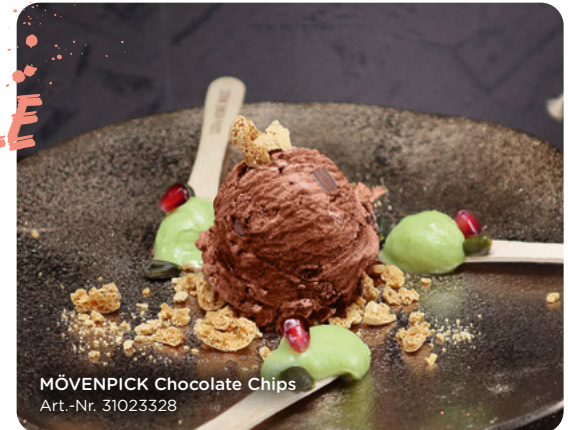
MÖVENPICK Chocolate Chips Art.-Nr. 31023328

Mozartkugel trifft Eisgenuss: MÖVENPICK Chocolate Chips im Duett mit Pistazien-Granatapfel-Lollies. Ein Fest für die Sinne!