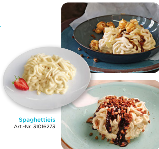
Spaghettieis Art.-Nr. 31016273

Spaghettieis passt immer: Unser Allround-Talent lässt sich auch perfekt für die Winterzeit verwandeln. Einfach mit Schoko- oder Karamellsauce toppen oder mit warmem Glühweinkirschkompott servieren – fertig ist das zauberhaft leckere Dessert!