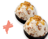
MÖVENPICK Maple Walnuts Art.-Nr. 31022065