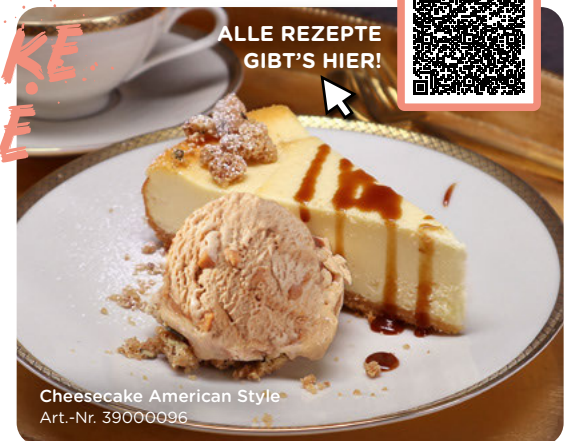
Cheesecake American Style Art.-Nr. 39000096

Weihnachtsdessert auf die amerikanische Art: Cheesecake American Style mit MÖVENPICK Caramelita, Crumble-Streuseln und Puderzucker – getoppt mit etwas Karamellsauce!