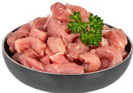
Schweinegeschneltzeltes aus dem Schinken 3-kg-Packung 942435