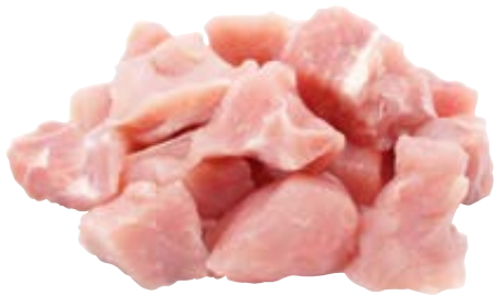
Schweinegulasch aus dem Schinken 2 x 2 cm 3-kg-Packung 942433