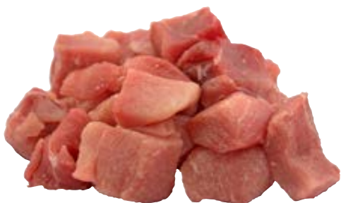
Schweinegulasch aus dem Schinken 3 x 3 cm 3-kg-Packung 942622